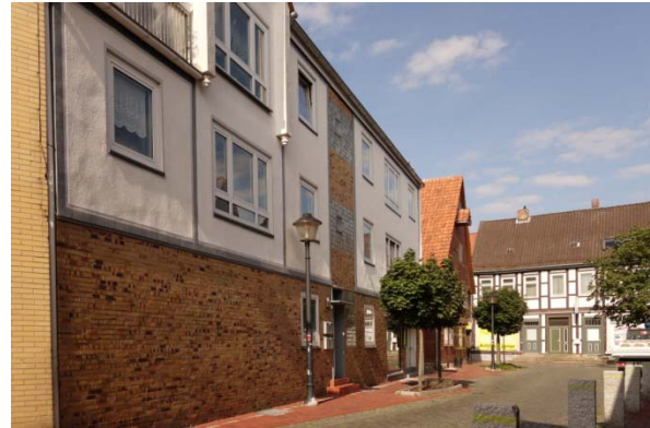
Abschnitt 2: Achterstraße bis Lange Straße