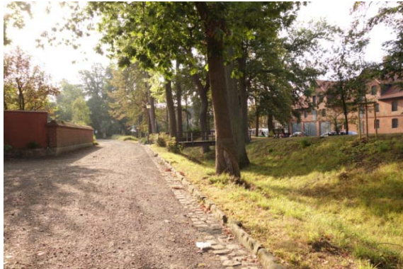
Blickrichtung Osten (in Höhe Spittastraße)