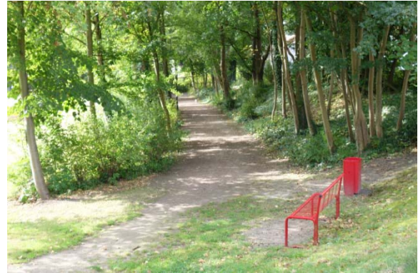
Kernbereich nahe der Gustav-Dobberkau-Straße Zugang über Bürgermeister-Heins-Straße