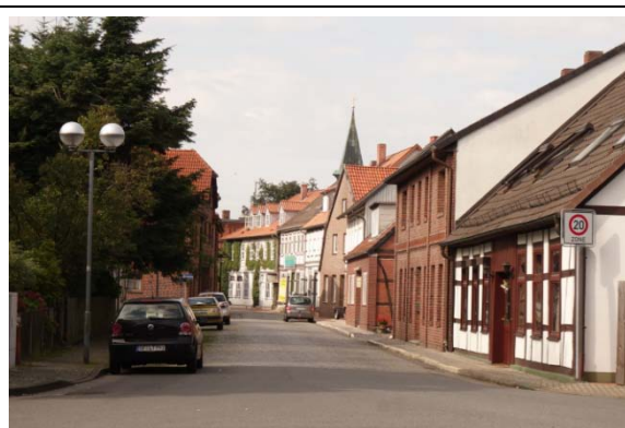
Abschnitt 2: Schmiedestraße bis Bromer Str.