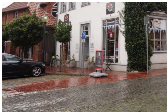
Oberflächengestaltung vor Gänsemarkt 6