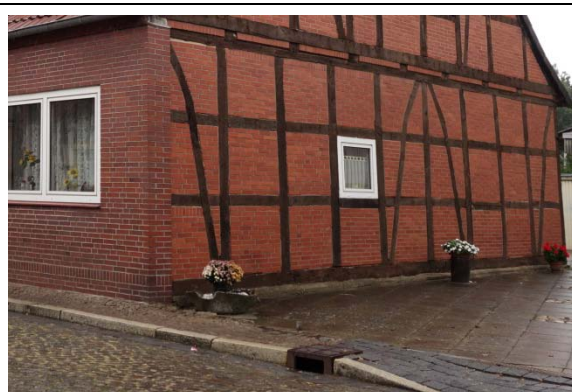
Nebenanlagen vor Nr. 66