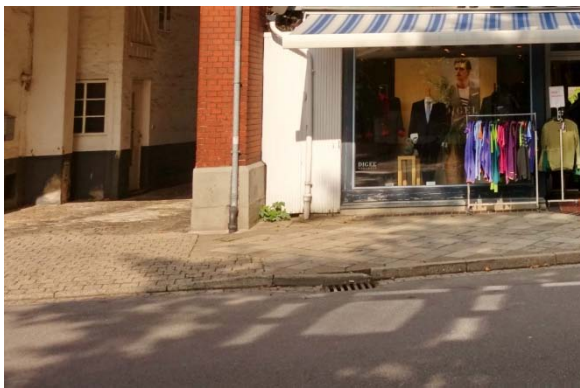
In Höhe Fulau 4