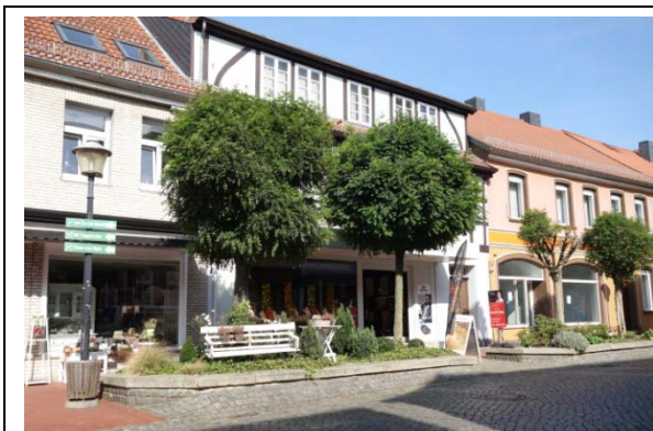
Abschnitt 1: Junkerstraße bis Schmiedestraße