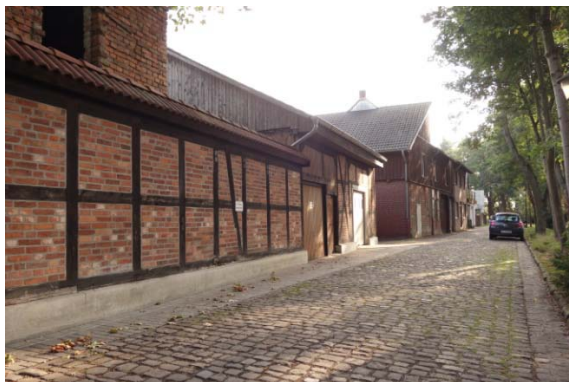
Blickrichtung Osten (In Höhe Marktgasse)