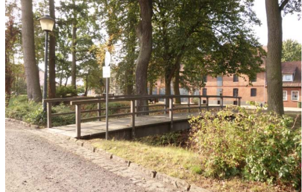
Fußgängerbrücke im westlichen Abschnitt