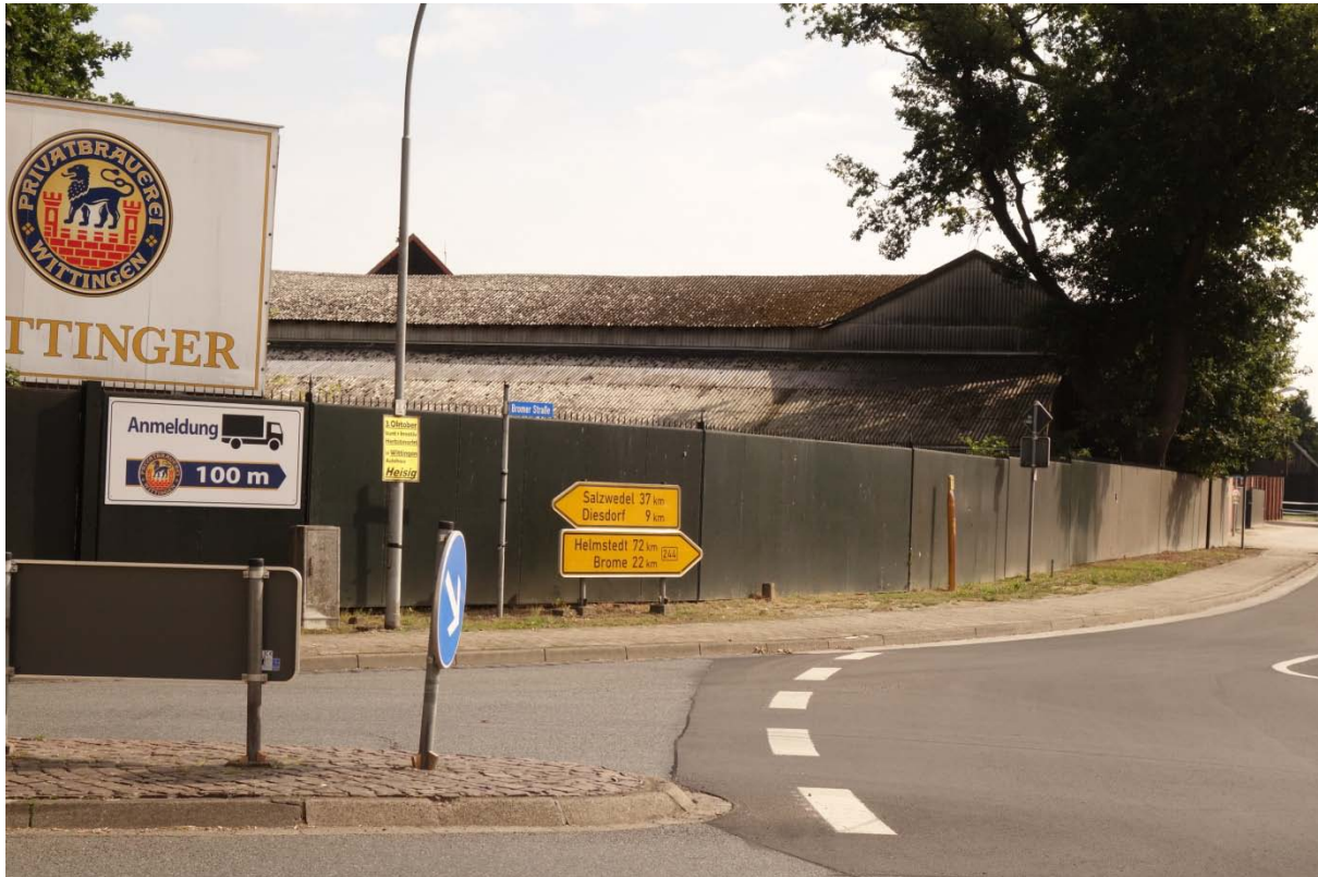
Kreuzungsbereich mit der B244. (Verkehrsflächen nicht Bestandteil des Untersuchungsgebietes).