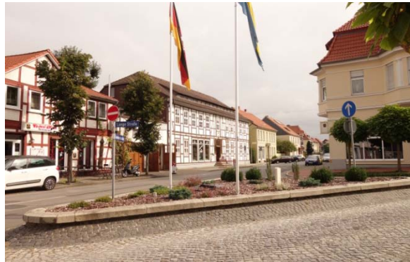
Blickrichtung Ost, Einmündung Lange Straße