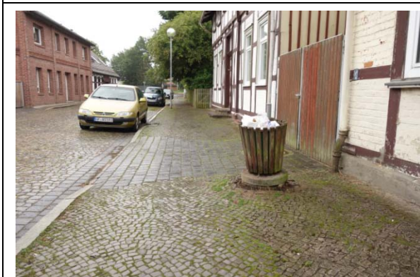
Gehweg in vor Nr. 63