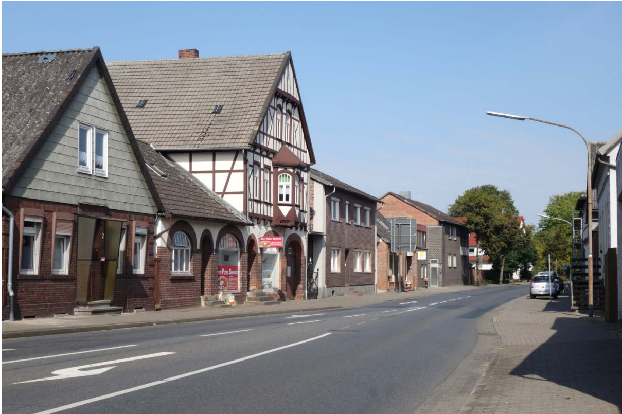
Blickrichtung Norden in Höhe Junkerstraße (Verkehrsflächen nicht Bestandteil des Untersuchungsgebietes).