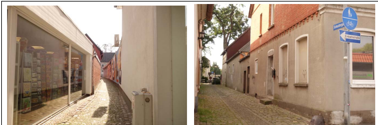
Blickrichtung Süd (in Höhe Lange Straße)