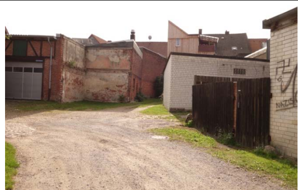
Abschnitt 2: Fulau bis Umweg