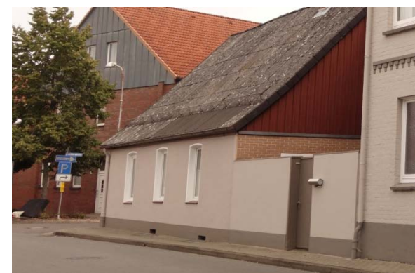
Schmaler Gehweg vor Nr. 4