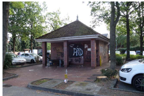
Servicegebäude am Wallparkplatz