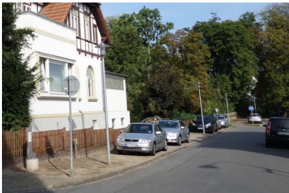
Abschnitt 2, Blick von der Junkerstraße