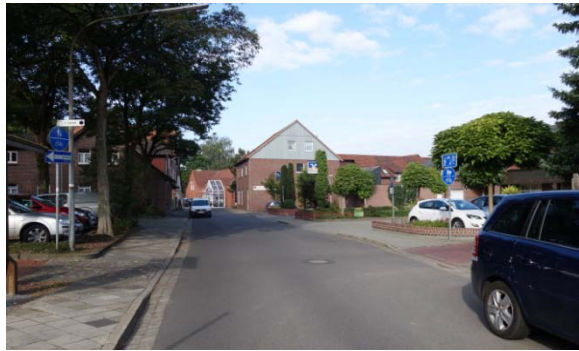
Blickrichtung West (in Höhe Marktgasse)