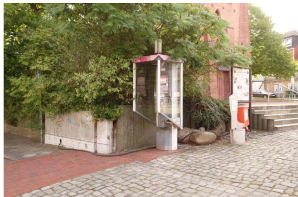
Nordöstliche Ecke des Platzes