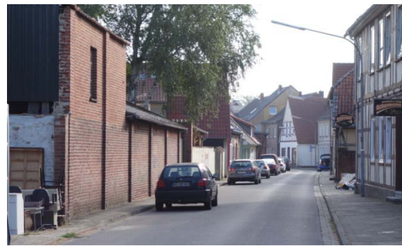
Blickrichtung Ost (in Höhe Marktgasse)