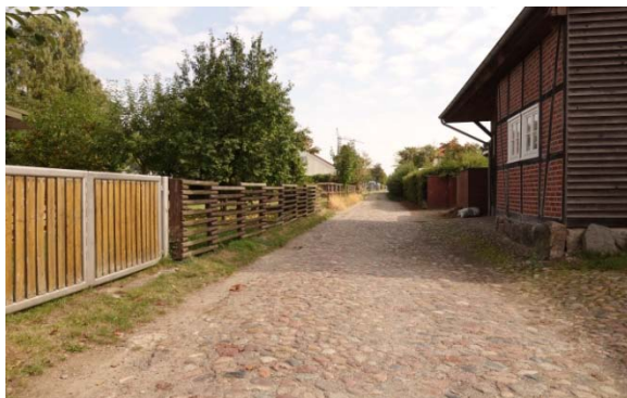
Abschnitt 2: Fulau bis Umweg