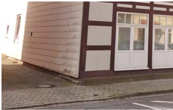
Schmale und teilweise unebene Gehwege