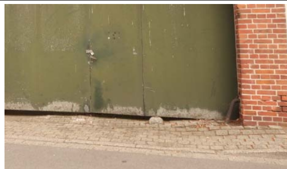
Nördl. Straßenseite: z.T. fehlender Gehweg