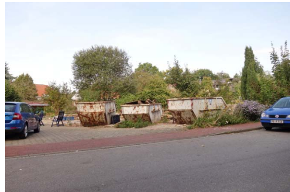
In Höhe Fulau 18