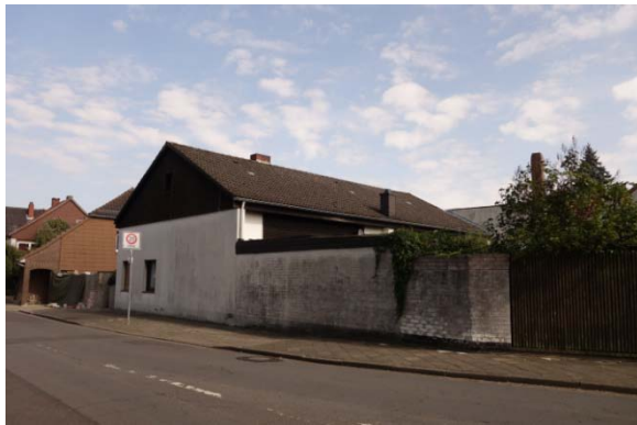
Abschnitt 1 : B244 bis Achterstraße