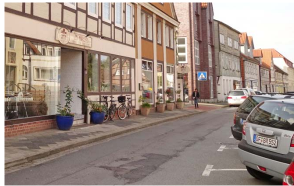
Mängel an der Fahrbahndecke