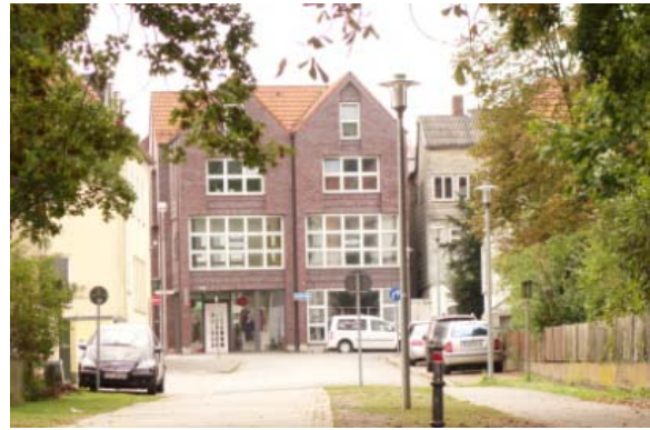
Abschnitt 2: Ende der Promenade bis Junkerstraße