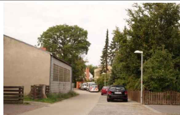
Abschnitt 1: Gutsav-Dobberkau-Str. bis Fulau