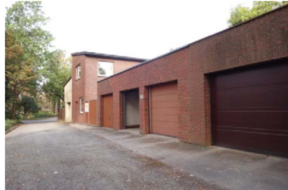
Zwischen Neue Straße und Marktgasse