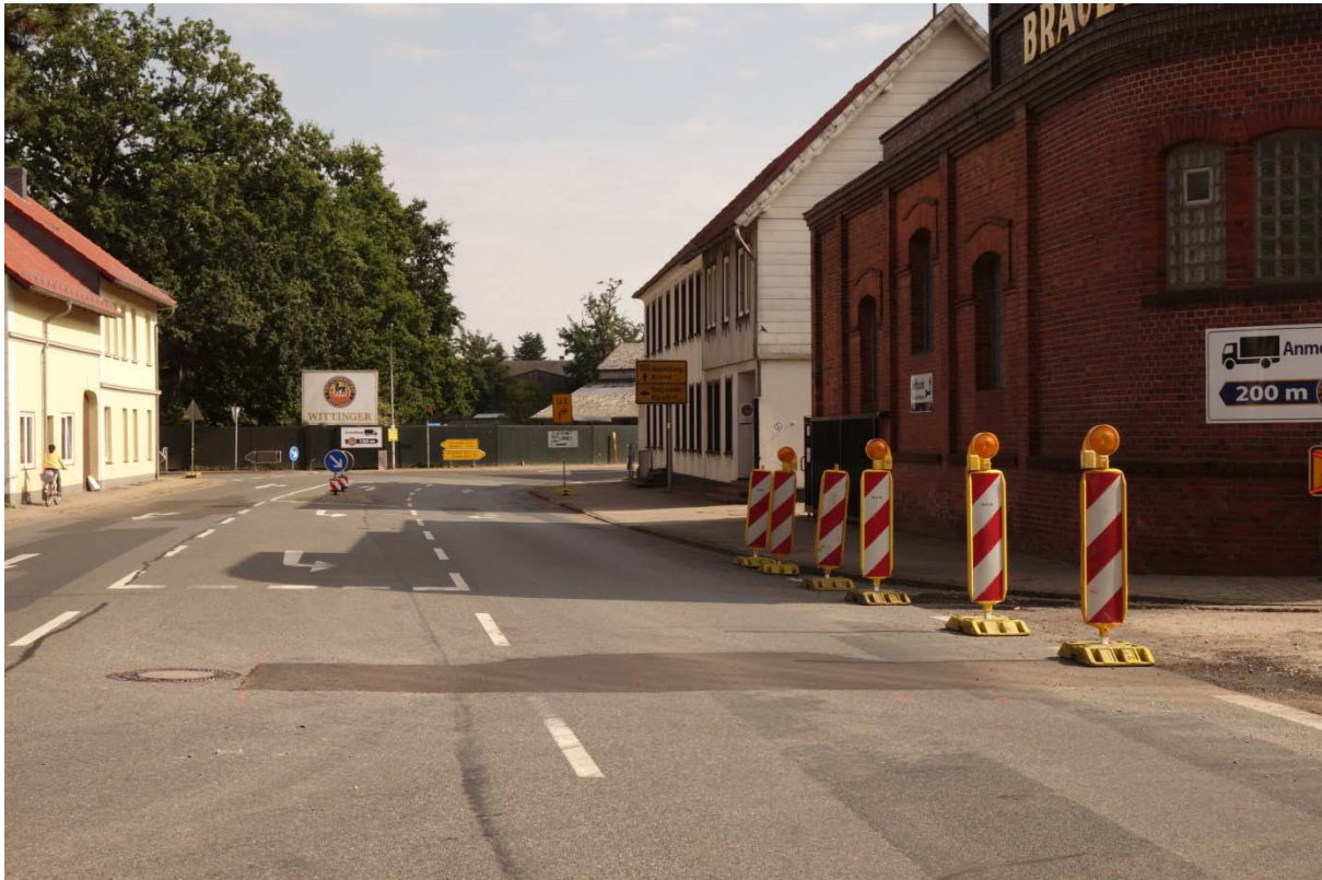
Blickrichtung Osten in Höhe Schützenstraße (Verkehrsflächen nicht Bestandteil des Untersuchungsgebietes).