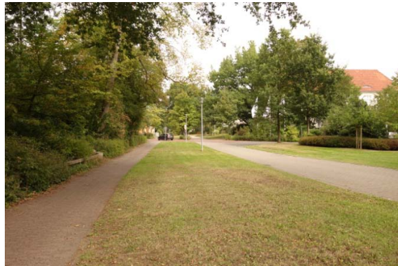
Abschnitt 1: Promenade